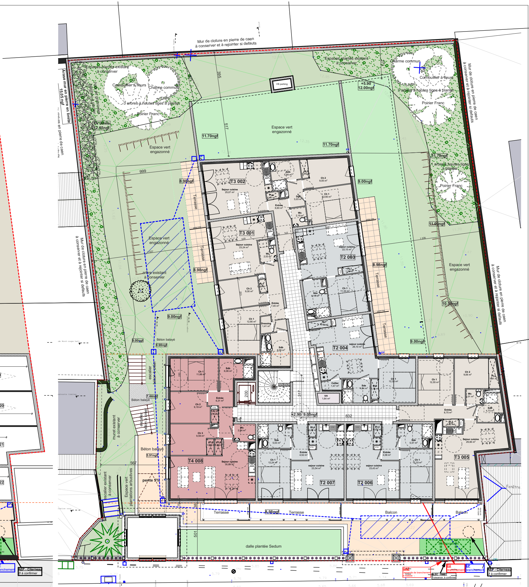
PLAN ETAGE 1